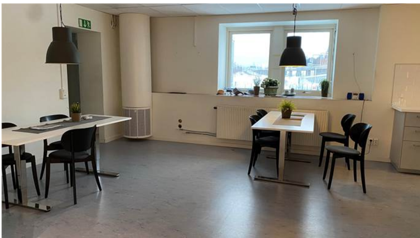
Del av kök