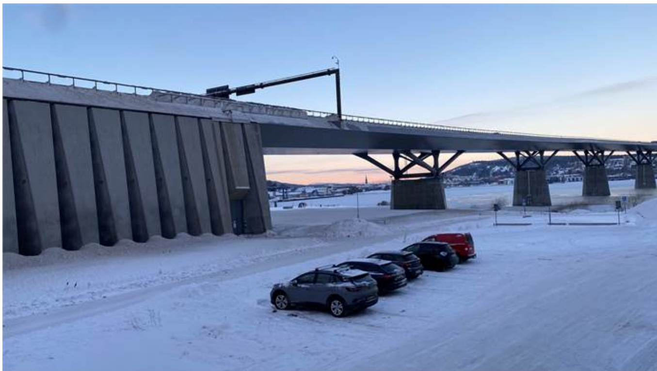
Utsikt från konferens/kontor