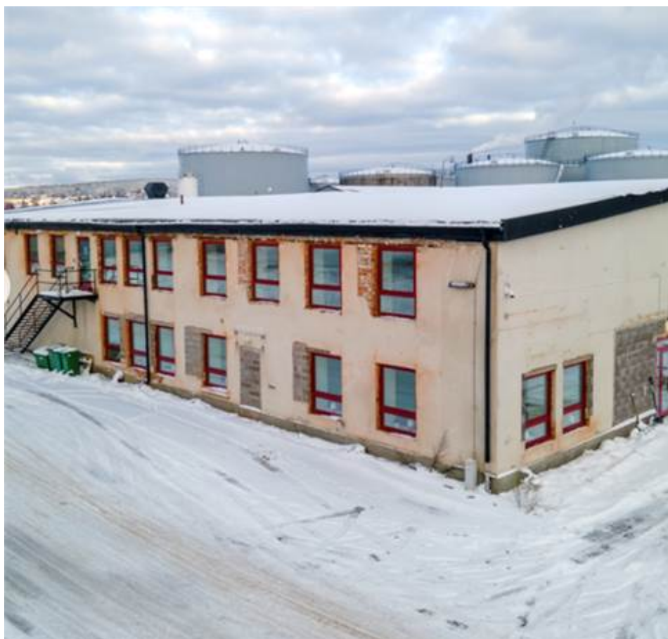
Del av utsida, ny fasad kommer 2024