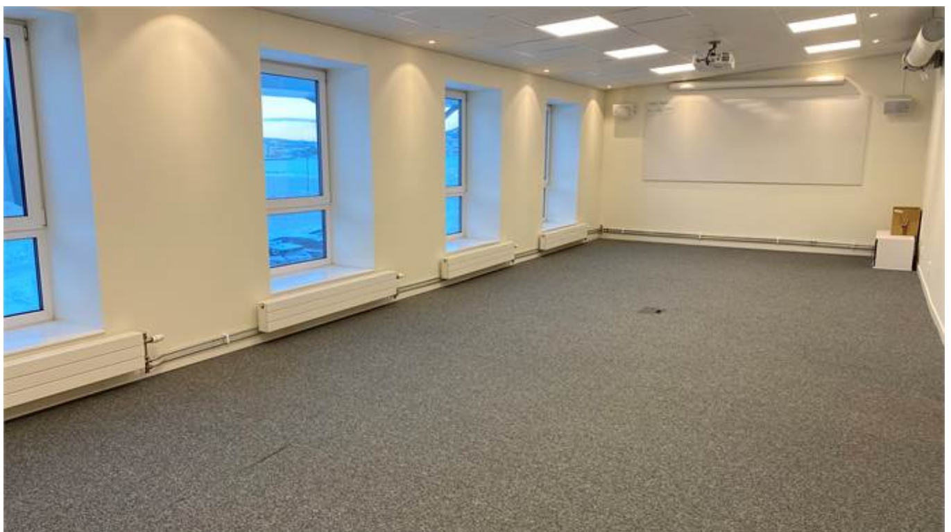
Del av konferens/kontor