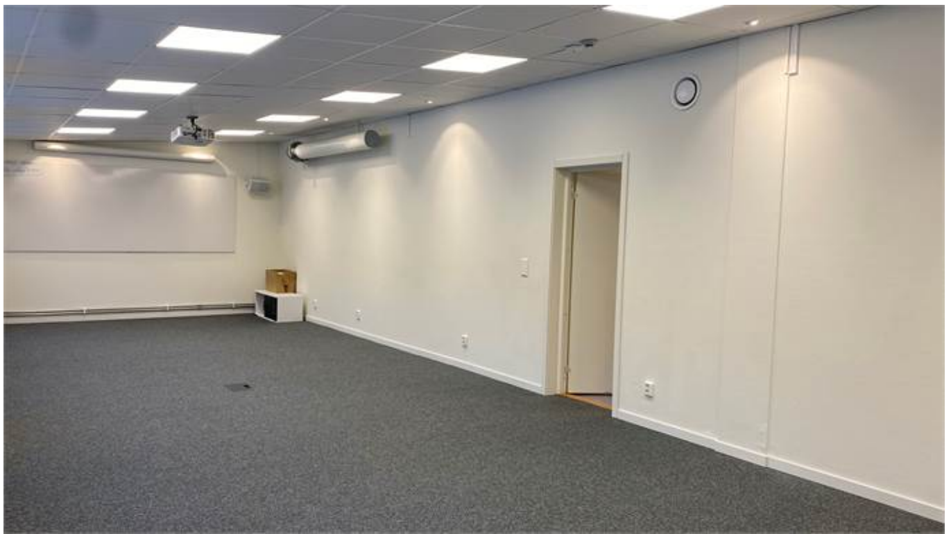
Del av konferens/kontor