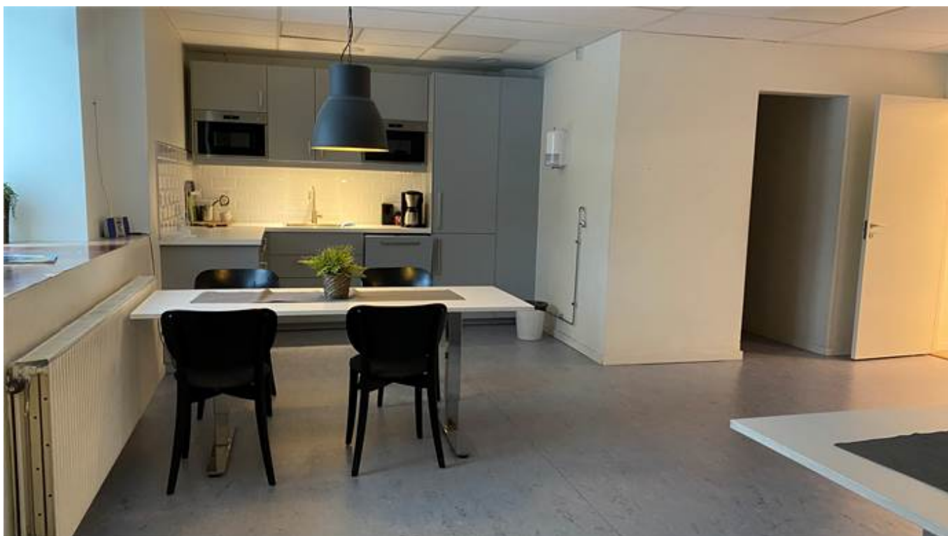
Del av kök