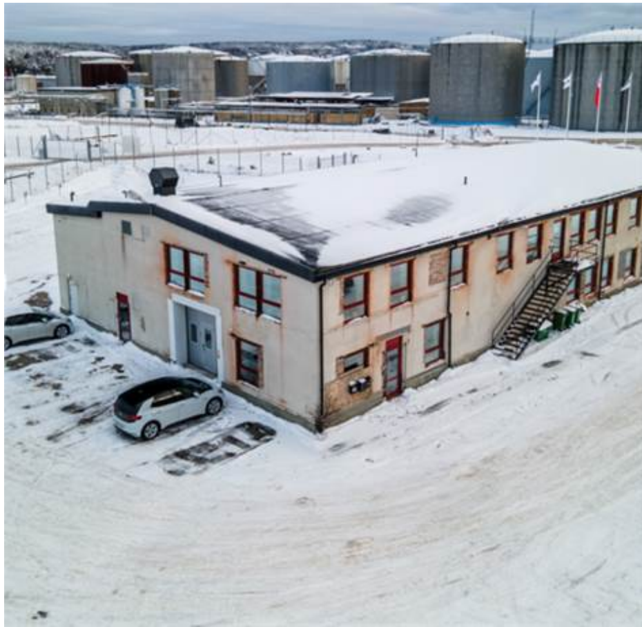
Del av utsida, ny fasad kommer 2024